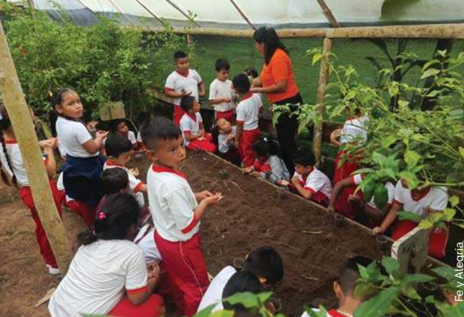
Fe y Alegría

📷 Les écoles de Fe y Alegría promeuvent l'écologie intégrale auprès des élèves, des éducateurs et des communautés des territoires autochtones de l'Amazonie.