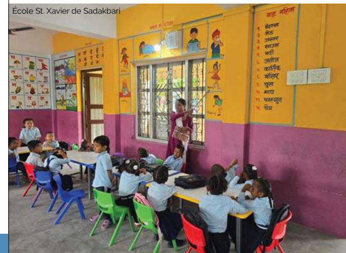
École St. Xavier de Sadakbari

📷 L'école St. Xavier de Sadakbari subventionne en grande partie les frais de scolarité dans le cadre d'une politique « aucun enfant laissé pour compte ».